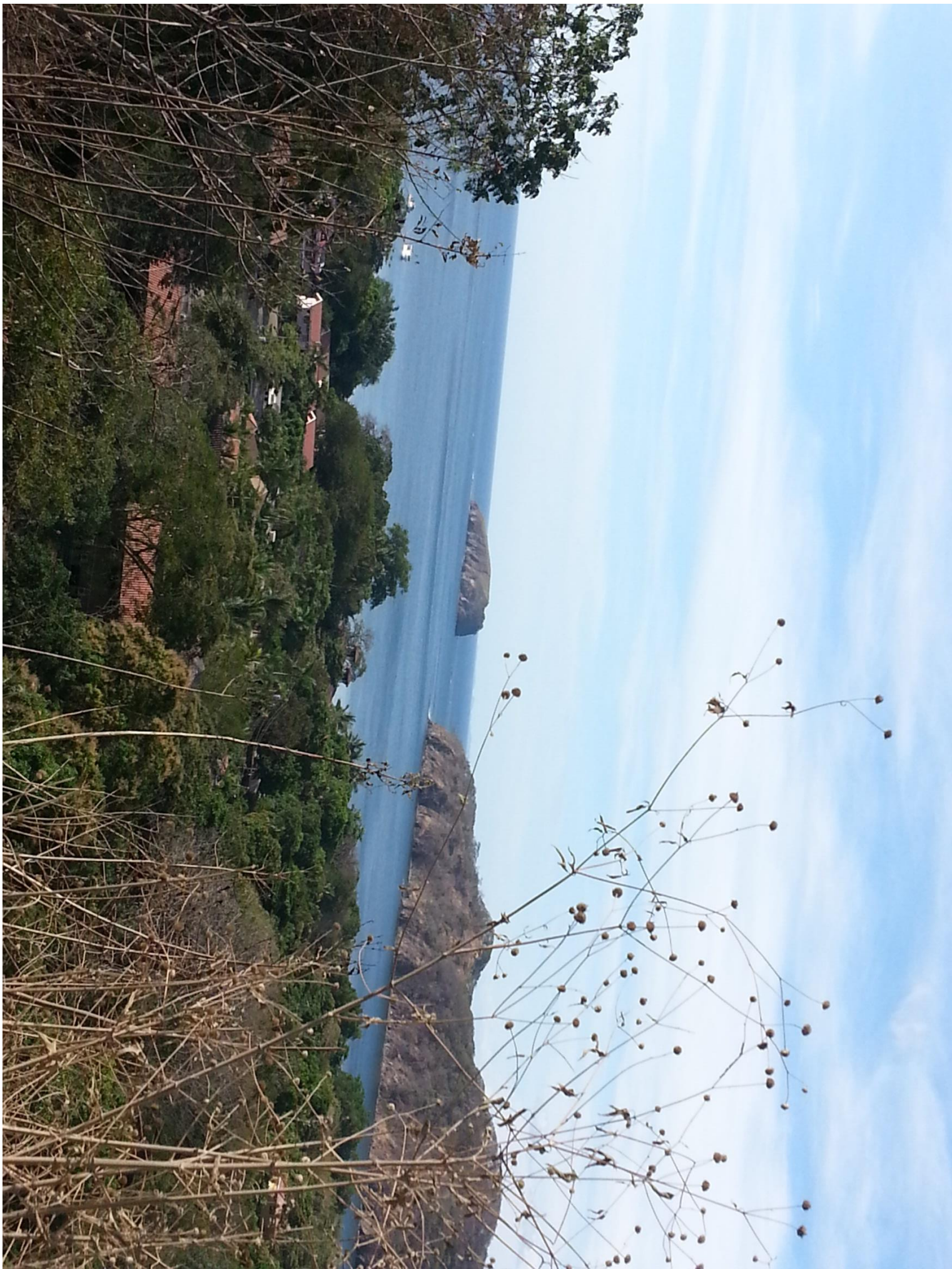
Vista dal Terreno